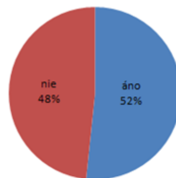
Blokovanie prístupu na stránky s nevhodným obsahom